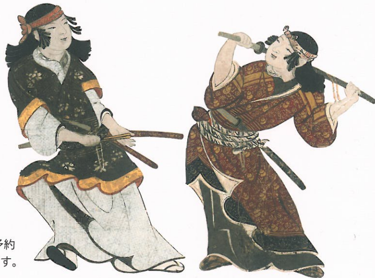
国宝 花下遊楽図屏風(部分)

特別展「桃山—天下人の100年」広報事務局(ユース・プランニングセンター内) 〒150-8551 東京都渋谷区渋谷1-3-9 ヒューリック渋谷一丁目ビル 3F TEL: 03-3406-3418 FAX: 03-3499-0958 E-mail: momoyama2020@yopcpr.com