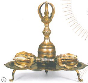
④ 空海が唐から持った密教法具