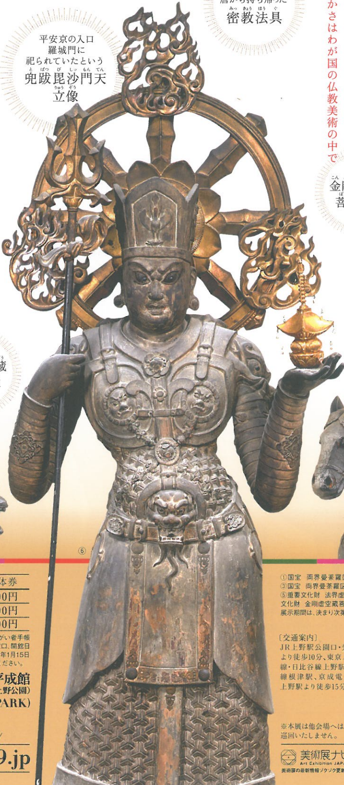
平安京の入口 羅城門に祀られていたという 兜跋毘沙門天立像

③ 来春、東寺の名宝、上野に大集結。 東寺は、平安京遷都に伴って、王城鎮護の官寺として西寺とともに建立されました。唐で新しい仏教である密教を学んで帰国した弘法大師空海は、823年に嵯峨天皇より東寺を賜り、真言密教の根本道場としました。2023年には、真言宗が立教開宗されて1200年の節目を迎えます。空海のもたらした密教の造形物は、美術品としても極めて高い質を誇り、その多彩さや豊かさはわが国の仏教美術の中で