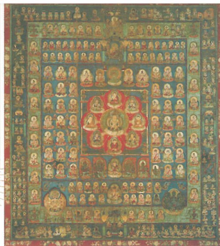
② 現存最古の彩色の両界曼荼羅

風高雲重 自天翔以 救之 閻之 如揭 雲霧 垂 惠止 觀妙 門頂 戴供 儀 之 妙 法 之 卷 供 儀 法 性 何 如 室 集 推 淨 觀 隨 命 躋 攀 彼 嶺 限 以 心 能 至 而 之 思 与 我 金 剛 及 室 山 集 會 一 處 量 高 仁 法 大 可 因 如 共 建 法 幢 托 仏 恩 德 望 不 憚 煩 勞 獲 淨 赴 此 院 此 心 望 之 淨 不 可 觀 空 衆 林 上 東嶺金剛 法海 九月十日