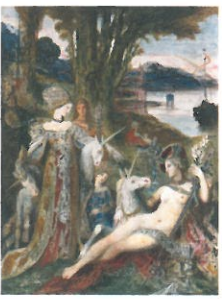
1.《出現》1876年頃 油彩/カンヴァス 2.《24歳の自画像》1850年 油彩/カンヴァス 3.《アレクサンドリーヌ》インク/鉛筆/紙 4.《一角獣》1885年頃 油彩/カンヴァス 5.《サロメ》1875年頃 油彩/カンヴァス Photo ©RMN-Grand Palais / Christian Jean / distributed by AMF 6.《エウロペの誘拐》1868年 油彩/カンヴァス 7.《トロイアの城壁に立つヘレネ》油彩/カンヴァス ●1~4、6、7: Photo ©RMN-Grand Palais / René-Gabriel Ojéda / distributed by AMF ●すべてギュスターヴ・モロー美術館蔵